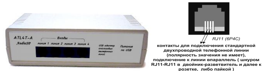
Рис. Вид спереди, входные розетки RJ11 – 4шт.