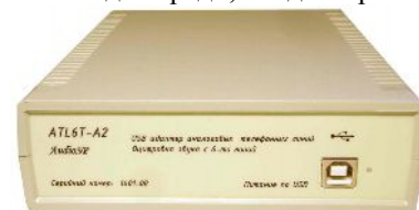
Рис. Вид сзади, розетка интерфейса USB BF